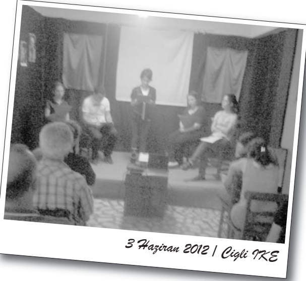
3 Haziran 2012 | Çiğli İKE