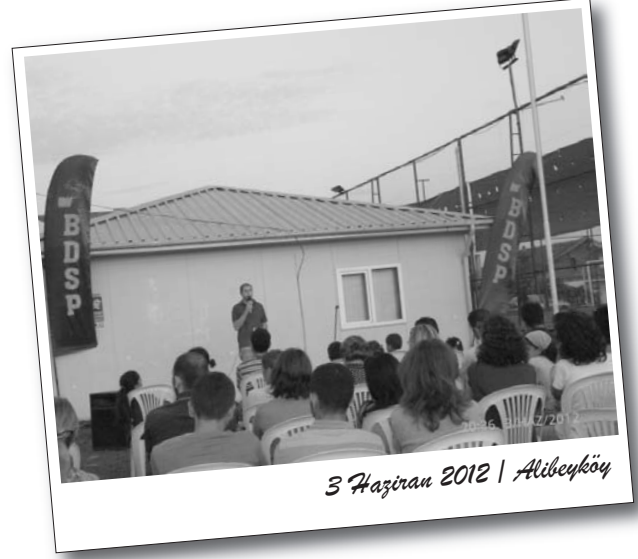
3 Haziran 2012 | Alibeyköy

Sermayenin işçi ve emekçilere karşı gerçekleştirdiği güncel saldırılar teşhir edilerek