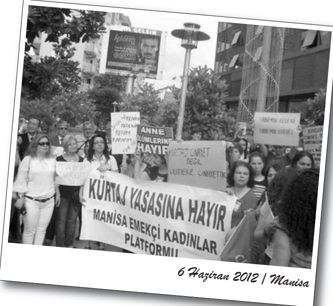
6 Haziran 2012 | Manisa

Otelin önünde toplanan Üniversiteli Kadın Kolektifi üyesi 5 kadın, "Türkiye'de Cinsiyet Eşitliği Uçurumunun Kapatılması" konulu oturuma konuşmacı olarak katılan Aile ve Sosyal Politikalar Bakanı Fatma Şahin'in yanlarına gelerek özür dilemesi gerektiğini belirterek, kürtajla ilgili yasanın çıkması durumunda binlerce kadının merdiven altında sağlıksız koşullarda ölüme terk edileceğini söylediler. Konuşmanın yapılacağı salona girmek isteyen kadınlar, polis