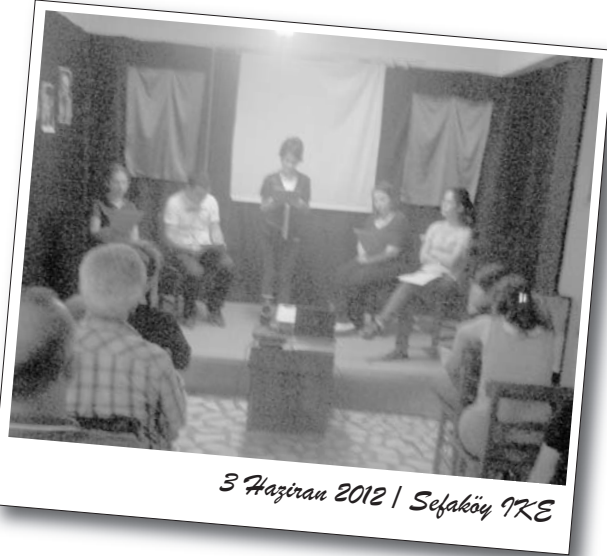
3 Haziran 2012 | Sefaköy İKE

Program "Hazıranda ölmek zor" şarkısı dinletilerek sona erdi.