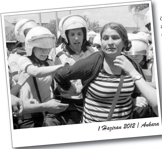
1 Haziran 2012 | Ankara