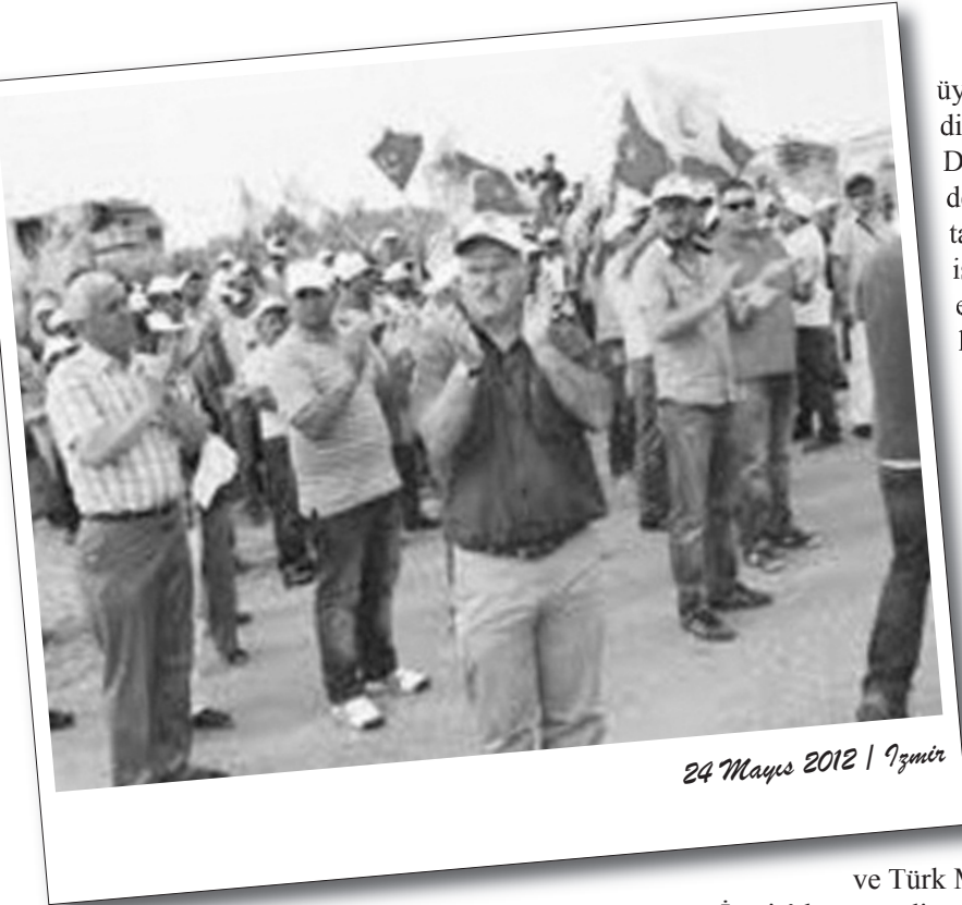
24 Mayıs 2012 / İzmir

Aliağa Organize Sanayi Bölgesi'nde (ALOSB) kurulu bulunan ve yüksek gerilim elektrik direkleri üreten MİCHA'da işçiler Türk Metal Sendikası'na üye oldukları için yaklaşık 1 ay önce işten çıkartılmışlardı.